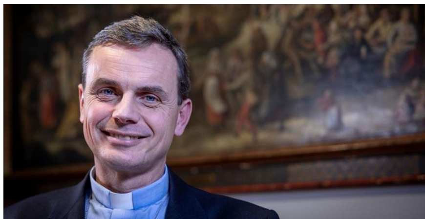
Luc Terlinden Archevêque de Malines-Bruxelles

« La paix soit avec vous ! » : c'est aussi le vœu que, de tout cœur, je formule pour vous et pour notre monde en cette fête de Pâques !